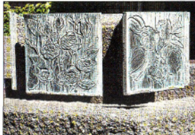
Brunnen mit 6 Bronze-Reliefplatten 1981/82, AOK, Schillerstr.4