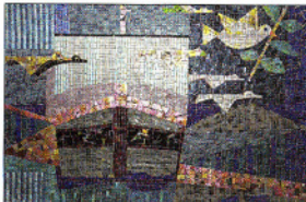
Glasmosaik „Arche Noah“ von 1964. Erstes Bild von einem Doppelbild, im Kindergarten, Fröbelstr. 10