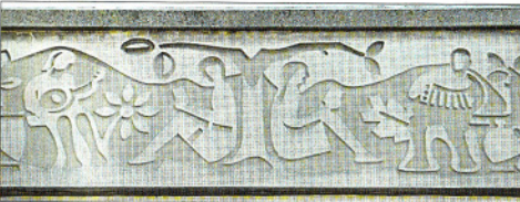
Sgraffiti aus dem Jahre 1953, KVHS, Am Rüttgen 60

Mohammed al Tani (König von Katar) für eine Küche 14 Fisch-Mosaik anzufertigen. Kurzum, er scheint der richtig Mann für diese Aufgabe zu sein.