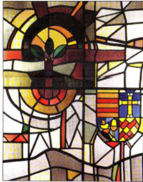
Bleiglasfenster 1957, AOK, Schillerstr. 4