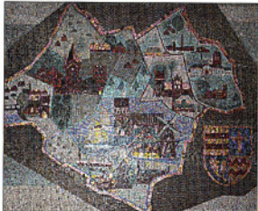
Glasmosaik „Ammerland“, 1963. Sitzungssaal des alten Kreishauses (jetzt Polizei) Wilhelm-Geiler-Str. 12