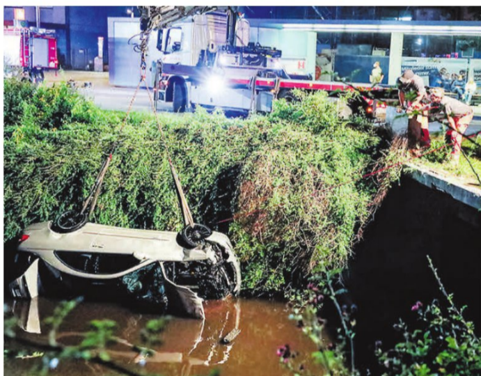
So passierte es: Am Mittwoch durchbrach ein Auto die Betonmauer mit dem Relief und landete im Wasser.

Für die nicht an die besonderen örtlichen Straßen- und Verkehrsverhältnisse angepasste Geschwindigkeit, die zu einem Unfall führte, seien ein Bußgeld von 145 Euro und ein Punkt in Flensburg vorgesehen. Die weiteren Unfallfolgen dürften jedoch (vermutlich für die Versicherung) deutlich teurer werden.