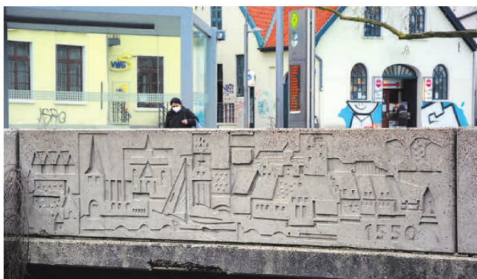
So sah es ursprünglich aus: Das Betonrelief zeigt „Oldenburg um 1550“.

Es handelt sich um ein Betonrelief, das der in Westerstede aufgewachsene und später in Oldenburg lebende Künstler Georg Schmidt-Westerstede (1921 bis 1982) gefertigt hatte. Er hatte es im Jahr 1967 als Auftragsarbeit im Zuge der Umgestaltung der Innenstadt zur Fußgängerzone